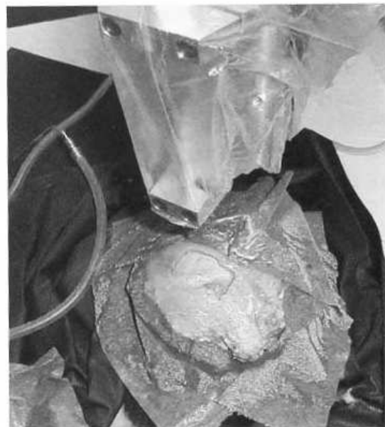
Abb. 2: Roboter-gestützt ausgefrästes Implantatlager in einer menschlichen Schädelkalotte (ohne Implantat). Oben ist der vom Knickarmroboter gehaltene Fräser unter der Abdeckungsfolie zu erkennen.

Es handelt sich um den Aufbau des ersten Roboter-gestützten Systems zum Fräsen an der lateralen Schädelbasis. Durch Rückkopplung der Sensordaten lässt sich ein menschähnliches Fräsen nachahmen. Mehr noch: es besteht die Möglichkeit der auto-